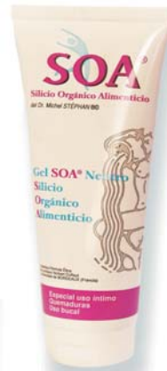
Gel Neutro 125ml.