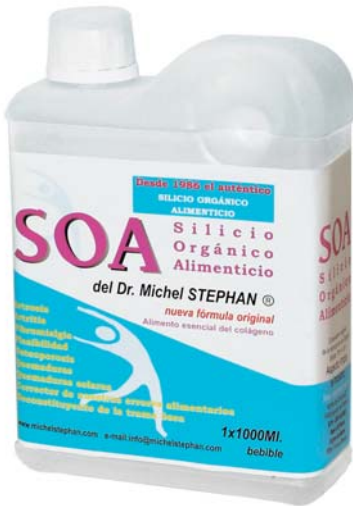
Bebible 500ml y 1000ml.