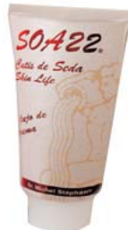
Crema Facial 50ml.