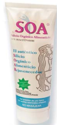
Gel con aceites esenciales y colágeno 125ml.